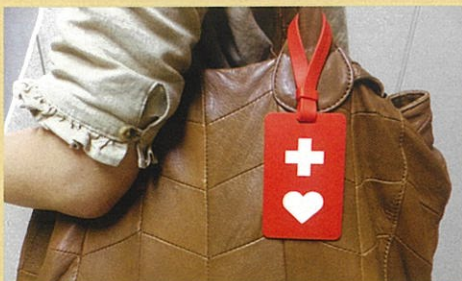
▲ 鞆などにつけられます。