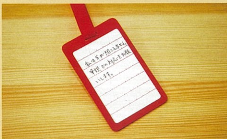
▲ 裏面にシールを貼り、必要な支援を書くことができます。