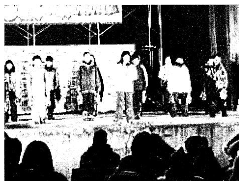
【R4年度のしばれフェスティバルの様子】

その1つが、12月11日（水）に実施する陸小祭りです。この活動のねらいは、保護者をはじめ多くの町民の方々をお招きすることによって、多くの人と接したりおもてなしたりすることにあります。平日開催ではありますが、多くの方々に来校いただけたらありがたいです。また学年間の人数差の関係もあり、今年度から縦割り班での活動になりましたが、異学年で活動するよさを生かしてくれればよいと思います。