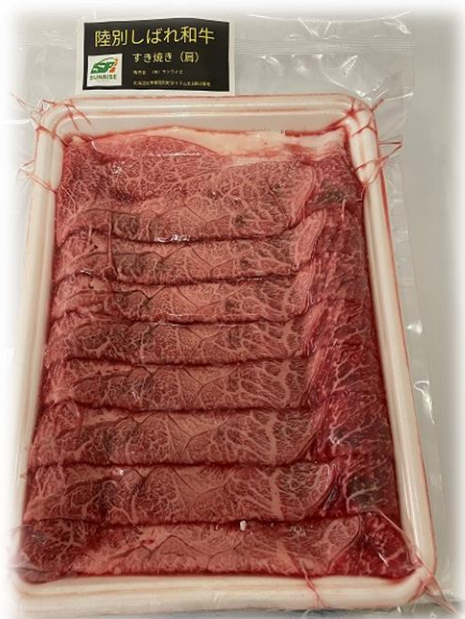
肩すき焼き 400g 3,480 円