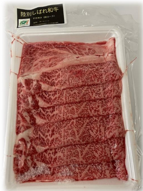
肩ロースすき焼き 400g 3,980 円