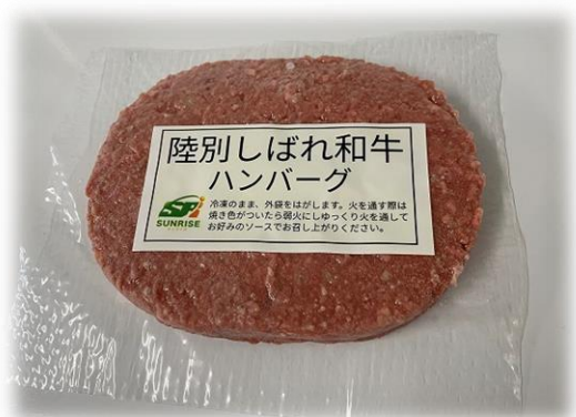
ハンバーグ 150g 500 円