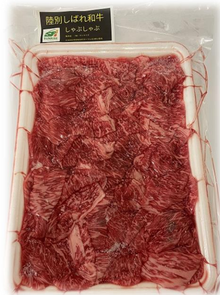
しゃぶしゃぶ 400g 3,480 円